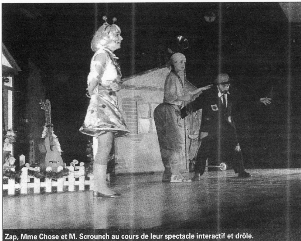
Zap, Mme Chose et M. Scrounch au cours de leur spectacle interactif et drôle.

Alors que Zap emmenait les spectateurs dans ses péripéties accompagnées de chants et de danses, le méchant Scrounch lui a dérobé sa télécommande pour tenter de manipuler le public. Mais celui-ci a su résister et devenir le complice de Mme Chose avant de donner une leçon de savoir-vivre à ce râleur solitaire. Sous la quête